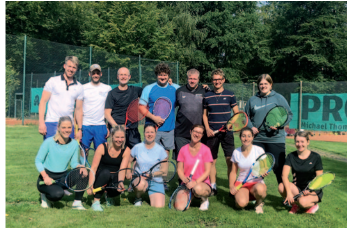
Die TeilnehmerInnen des Sommercamps 2023 freuen sich auf die Saisonöffnung und endlich wieder draußen spielen zu können.

Tennis ist ein super Sport für den ganzen Körper und den Geist. Studien