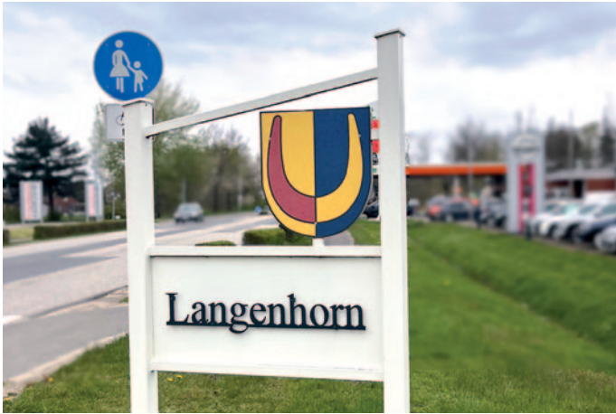
Langenhorn möchte mittels einer Umfrage Erkenntnisse über das Einzugsgebiet der Gemeinde erlangen.

Langenhorn. Mit Hilfe einer Umfrage möchte die Gemeinde Langenhorn wichtige Erkenntnisse für ihre kommunale Entwicklung gewinnen. An